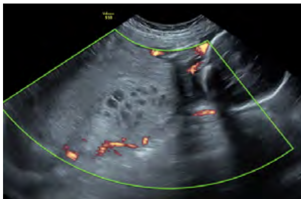
Figura 1. Imagen de ultrasonido, con zona de placenta normal y zona de placenta alterada con degeneración hidrópica. Paciente con embarazo feto vivo y mola parcial, Bogotá (Colombia), 2018

El ultrasonido obstétrico de detalle anatómico arroja los siguientes resultados: peso estimado fetal, 830 g; crecimiento menor del percentil 3 para la edad gestacional. En la valoración de la placenta se encuentra una imagen de 90 x 167 mm, con múltiples imágenes hipoeoicas en patrón de panal de abejas, sugestiva de enfermedad trofoblástica gestacional (figuras 1 y 2). La valoración de líquido amniótico confirma oligoamnios (ILA 3). En la evaluación Doppler se descarta acretismo placentario. El Doppler de hemodinamia fetal muestra aumento de resistencia en arteria umbilical. Resistencias normales en arteria cerebral media y ductus venoso. La valoración fetal evidencia feto de sexo femenino, con lesión focal hepática en lóbulo derecho de 25 x 26 mm, hipoeoica irregular, con septos pequeños y sugestiva de hamartoma mesenquimatoso hepático (figura 3); resto de la anatomía fetal normal. Se realiza una impresión diagnóstica de gestación de 33 semanas, preeclampsia sin criterios de severidad, enfermedad trofoblástica con coexistencia de feto vivo, restricción de crecimiento