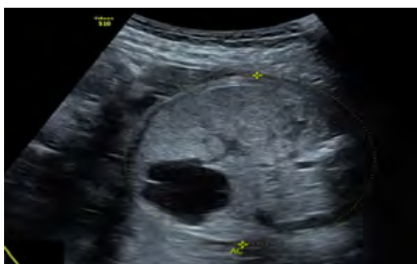
Figura 3. Imagen quística intrahepática fetal, sugestiva de hamartoma. Paciente con embarazo feto vivo y mola parcial, Bogotá (Colombia), 2018