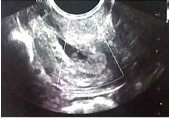
Figura 1. Ecografía pélvica transvaginal

A nivel endocervical (distal al orificio cervical interno) se observa saco gestacional único irregular con pérdida de la turgencia y elongación distal que mide 18 x 7 mm, en cuyo interior se identifica saco vitelino de 3 mm. La imagen es compatible con un embarazo ectópico cervical de 5 semanas, 6 días