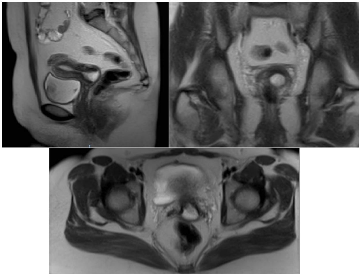
Figura 1. Imágenes de RM, donde se observa una masa de 25-30 mm, que distiende el canal endocervical en una mujer con un adenosarcoma de endocérnix y endometrio

cuales rechazó continuar con tratamientos coadyuvantes (incluida la radioterapia). El seguimiento se realizó de forma parcial e incompleta, ya que solo deseaba ser valorada por el equipo de Ginecología Oncológica, rechazando continuar con cualquier otro seguimiento, tanto en Oncología Radioterápica como en Oncología Médica. Los controles posteriores realizados desde la intervención (hace 4 años), y las pruebas complementarias solicitadas han sido normales; actualmente se encuentra libre de enfermedad (última consulta, 2019).